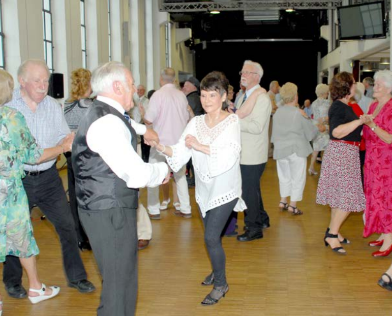
Tanztee im Wesselingener Rheinforum – Tanzspaß für Jung und Alt