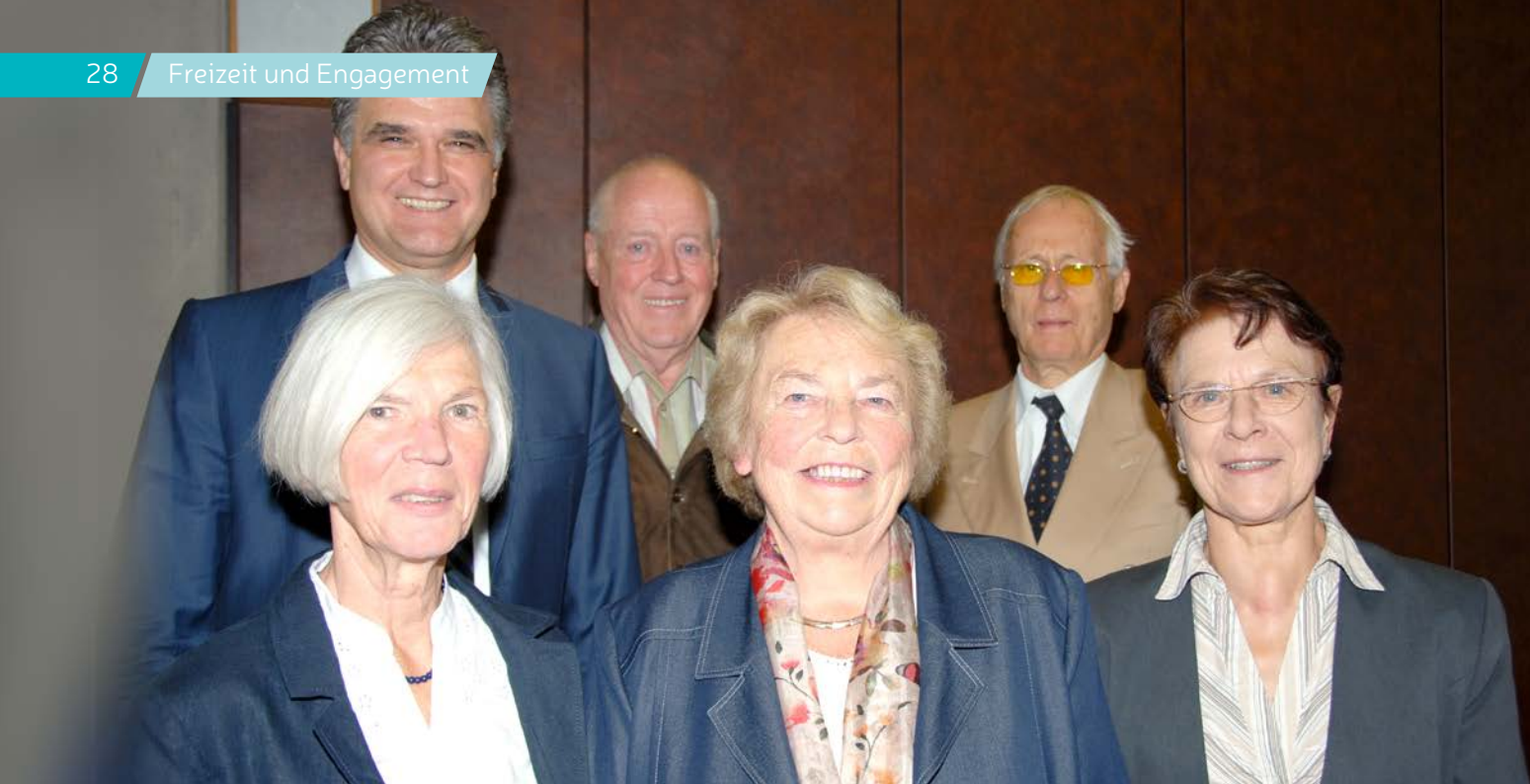
Der Vorstand vom Seniorenbeirat Wesseling