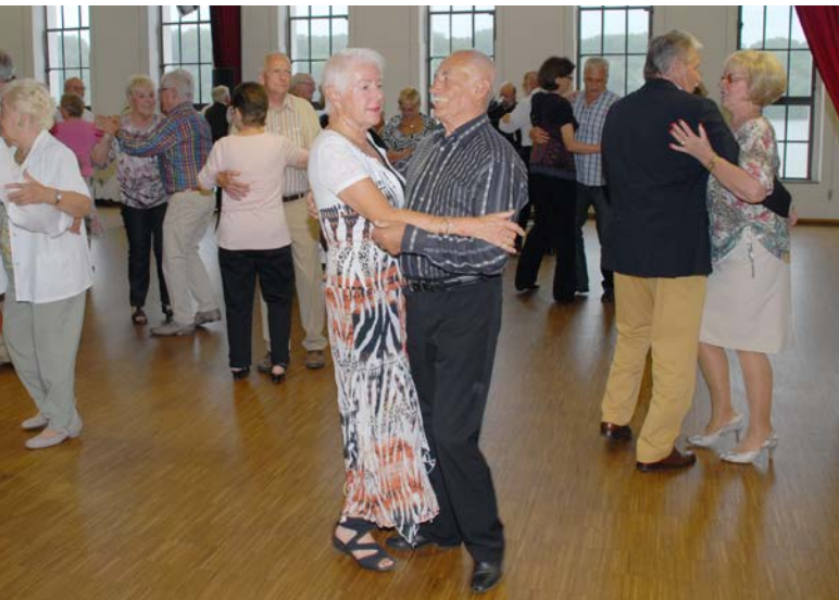
"Tanzen ist die beste Prävention"