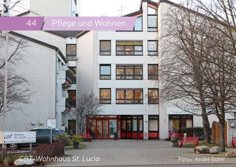
CBT-Wohnhaus St. Lucia