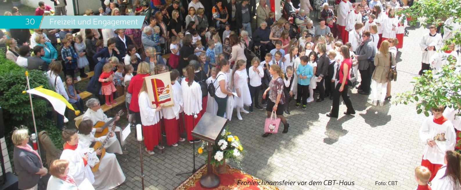
Fronleichnamsfeyer vor dem CBT-Haus