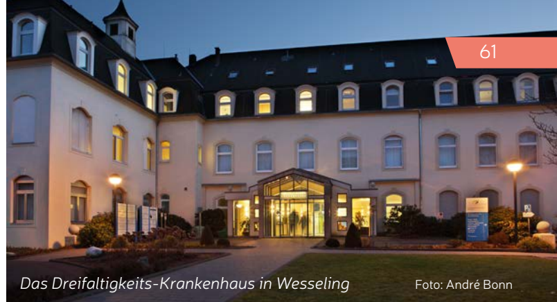
Das Dreifaltigkeits-Krankenhaus in Wesseling